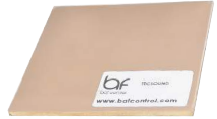
TECSOUND BARIYER TECSOUND BARRIER